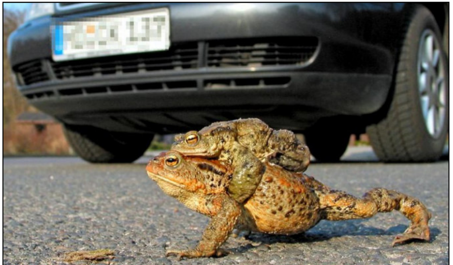
Erdkröten bei der Wanderung