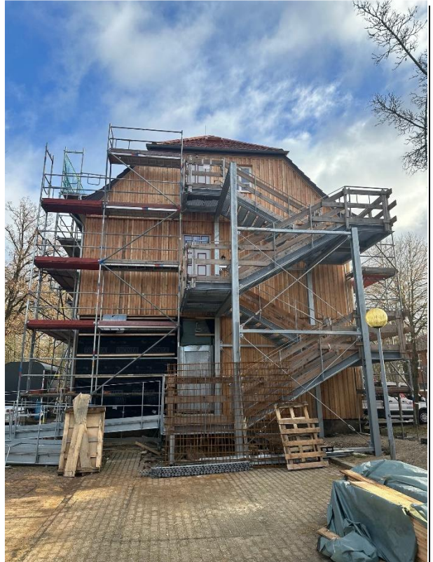
Giebelfassaden des Jungeninternatsgebäudes